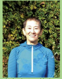
日本山岳ガイド協会 登山ガイドステージII 大阪山岳連盟・理事

各回 登山学校メンバーズカード会員 ¥9000 一般 ¥10000 ※当日経費あり 催行4-8名